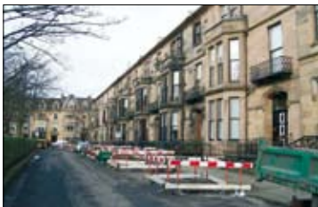
Typical rehabilitation works