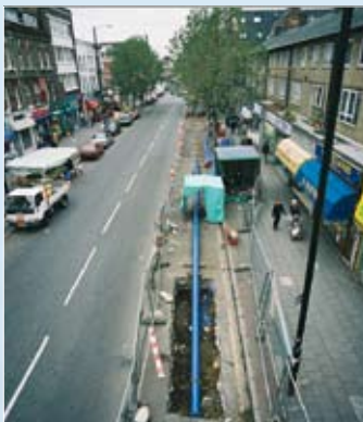
Типичная замена водопровода