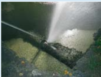
Типичный прорыв водопровода